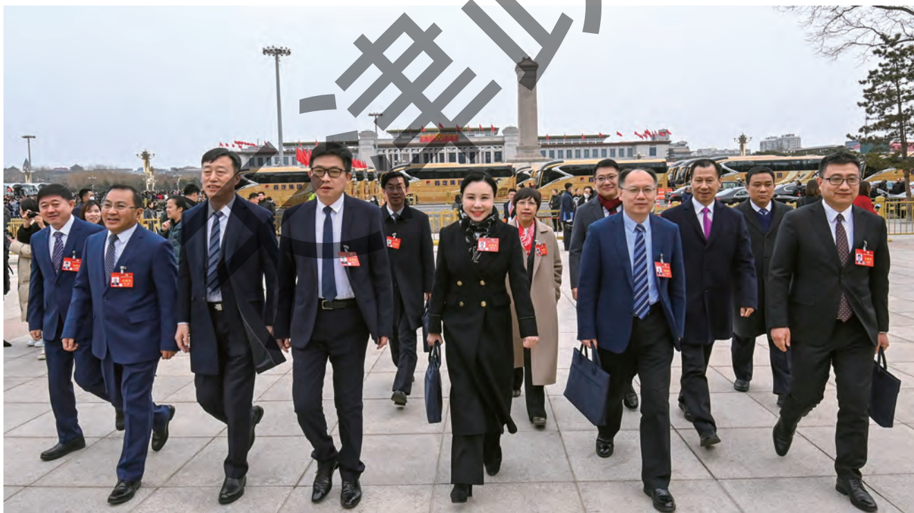
住津全国政协委员赴京出席全国政协十四届二次会议，步入人民大会堂。