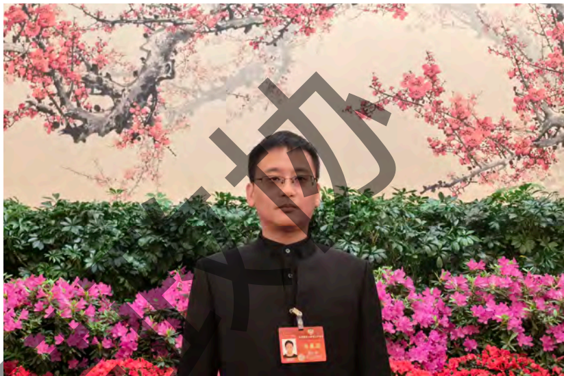
全国政协委员周小平在人民大会堂留影

去的十几年中，周小平在互联网上坚持走在舆论阵地前线，共发表原创文章7000余篇，总计2900余万字，总阅读量约15亿次（以腾讯微信实名认证手机阅读总次计），连续八年蝉联全国时政评论原创博主排名前二十。“我很荣幸能担任第十四届全国政协委员，也希望能通过这个平台将自己在互联网和新媒体舆论场耕耘20多年的经验分享出来，为国家民族复兴和文化复兴贡献自己微薄的力量。”