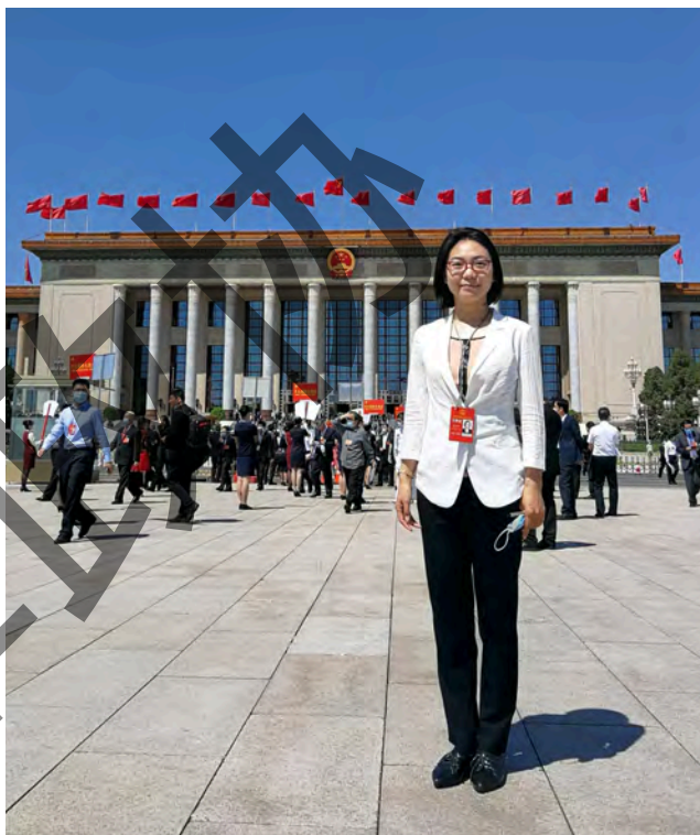
服务全国两会期间在人民大会堂前留影

记得第一次走进北京友谊宾馆，来不及欣赏古色古香的贵宾楼和友谊宫广场上庄重典雅的巨松，我便投入了紧张的会议筹备工作中。早上6点起床，7点半已经推着行李车到大厅摆放文件；一整天，迎接陆续抵京的全国政协委员，完善委员信息，发放会议文件；晚上，整理报到信息、熟悉委员情况、制作各种表格，开完小组会再研读厚厚的会议须知和简报工作培训手册，一抬头看表已是凌晨。5次全体会议、1次常委会会议、2次列席人大会议、11场小组讨论，发放文件物品、撰写主持词、会议记录、简报编辑，