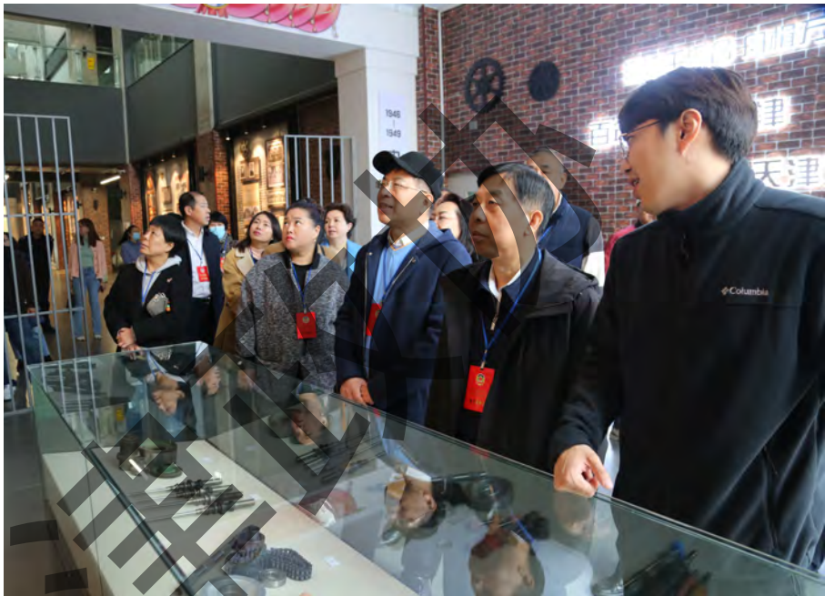
组织政协委员深入棉3创意街区就重点提案办理进行现场调研

河东区政协深入学习贯彻习近平总书记关于加强和改进人民政协工作的重要思想，充分发挥提案在服务河东经济社会发展中的重要作用，通过严把提案立案关、办理关、评优关，不断提升提案围绕中心工作的准度、服务大局工作的力度、惠及百姓生活的温度，以提案工作提质增效助力社会主义现代化品质活力区建设。