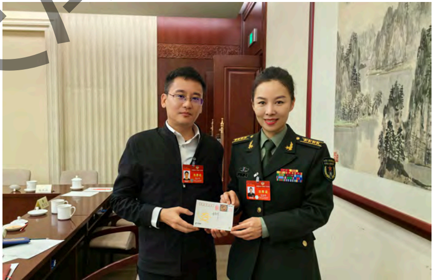
全国两会期间，周小平委员帮云南边区的孩子们要到航天英雄王亚平的签名明信片。