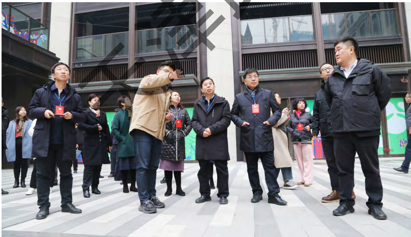
河东区政协组织委员视察建成开业的海河东岸俄欧风情街