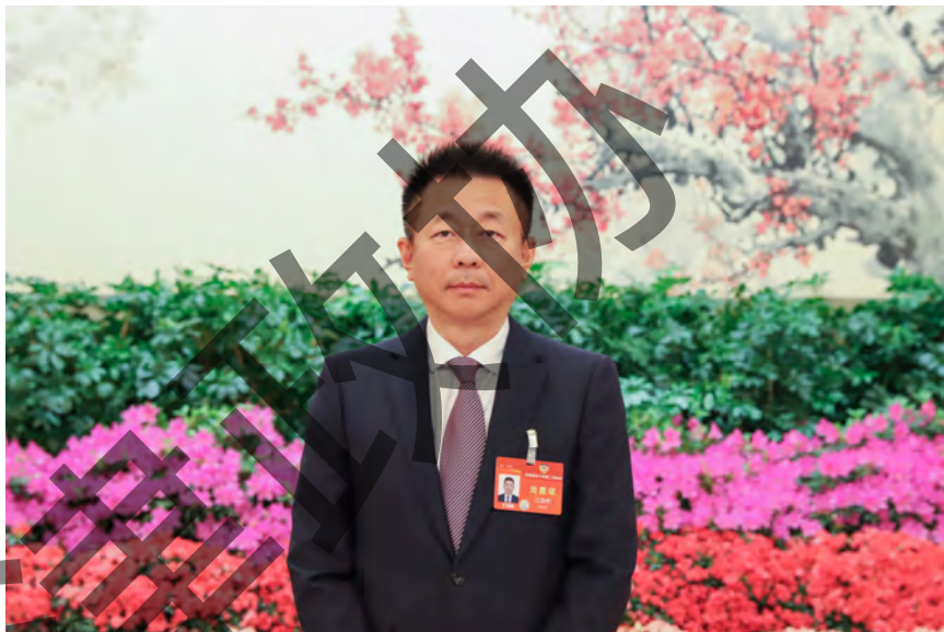
全国政协委员江浩然在人民大会堂留影