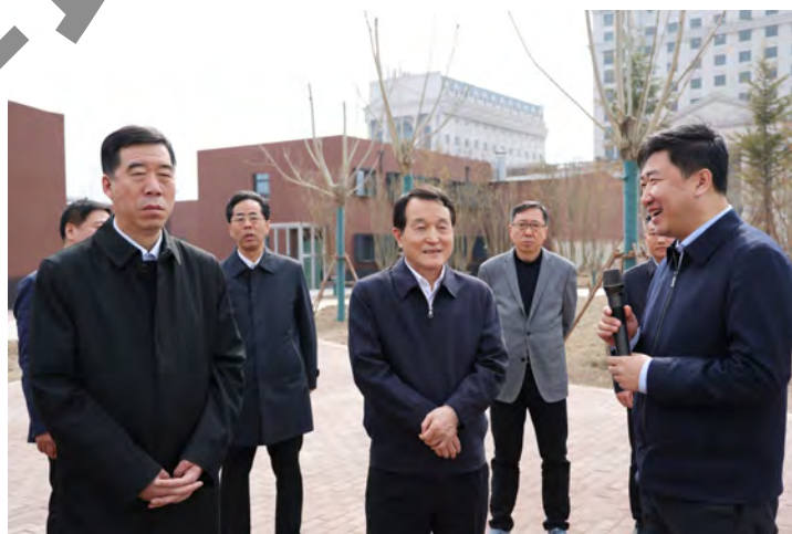
■ 市政协主席王常松深入滨海新区、河东区、东丽区、津南区，就学习贯彻习近平总书记视察天津重要讲话精神，落实市委关于推进盘活存量资产情况进行调研。