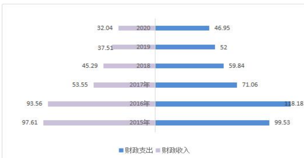
图 2：和平区 2015-2020 年区级财政收支对比图