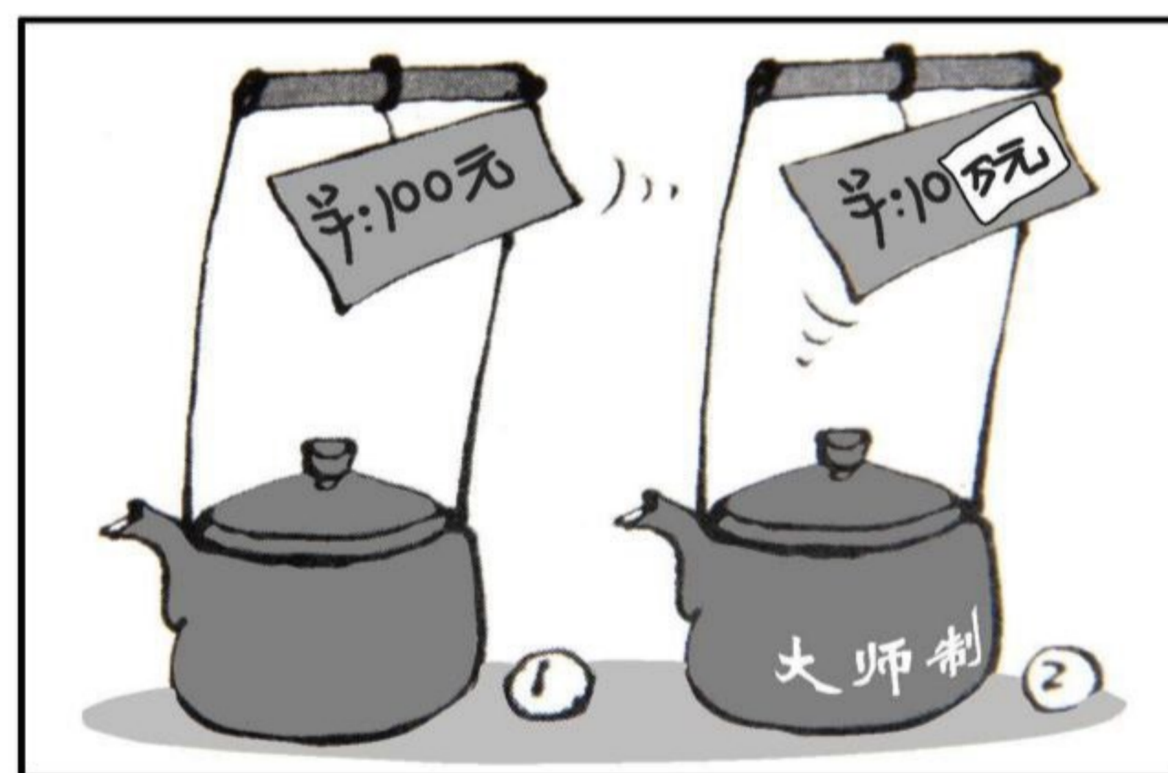
《摇身一变》 作者:王铎

6. 为应对新冠肺炎疫情对经济社会的不利影响,某市发放了普惠型和红利型两种消费券。普惠型消费券人人有份;红利型消费券只对低保、特困等四类救助对象发放。发放红利型消费券