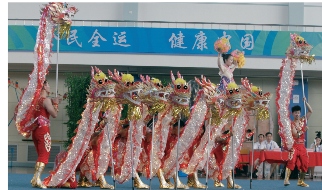
▲第十三届全运会群众比赛舞龙决赛收官，本期 A03 版精彩回放赛场内外。

演练现场，刘清早按照全运村各中心重点专项工作流程、点位及风险管理列出 110 个问题，逐一专项负责人、对接人进行提问，相关人员现场应答。针对回答，刘清早当即指出疏漏点，提出纠正完善意见。